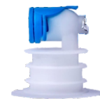
Válvula VTOP Polietileno Lineal de Baja Densidad

Capas Internas: PEBD Cristal Espesor: 50u Gramaje: 46 g/m 2 Tolerancia: +/- 9